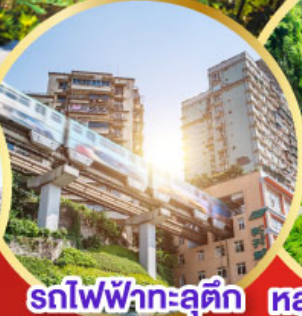
รถไฟฟ้าทะลุติ๊ก หลุมฟ้าสะพานสวรรค์