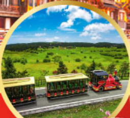
อุทยานเขานางฟ้า