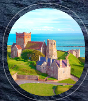
United Kingdom Dover

ราคารวม : อาหารทุกมื้อบนเรือสำราญ, ทิปพนักงานบนเรือ, ท่าอากาศยาน | ราคาไม่รวม : ตั๋วเครื่องบิน, ค่าทำวีซ่า, ภาษีเตรียมบนฝั่ง