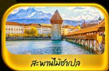
สะพานไมชาเปลา