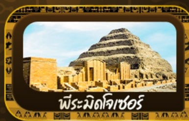
พีระมิดโจเซอร์