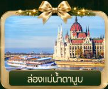
ล่องแม่น้ำดานูบ