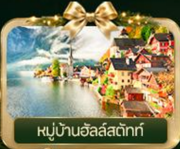
หมู่บ้านฮัลล์สตัดท์