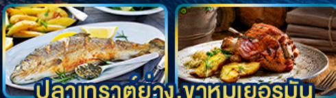
ปลาเทราต์ย่าง, จานหมูเยอรมัน