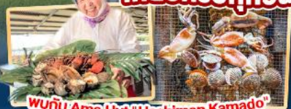
พบกับ Ama Hut "Haohiman Kamado" เมนูพิเศษ SEA FOOD