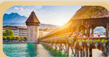
สะพานไม้ม้าเปลา

25 มี.ค. - 01 เม.ย. 69 / 04-11 เม.ย. 69 08-15 เม.ย. 69 / 28 เม.ย. - 05 พ.ค. 69 27 พ.ค. - 03 มิ.ย. 69