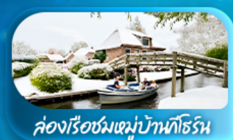
คลองเรือชมหมู่บ้านโทริช

พิเศษ ล่องเรือแม่น้ำเซน ชมเมือง โดย บาโต มูช