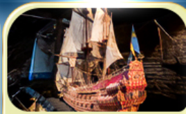
พิพิธภัณฑ์ทิวาซ่า