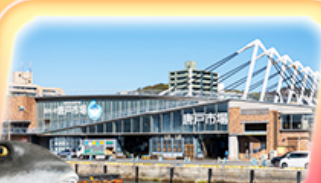
ตลาดปลาอาราโตะ

✈ สายการบิน Vietjet Air (VZ) น้ำหนักกระเป๋า 20 KG vietjetair.com