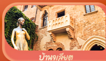
บ้านจุงเคิลง