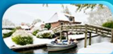
ล่องเรือชมหมู่บ้านทึโรน

พิเศษ ล่องเรือแม่น้ำเซน ชมเมือง โดย บาโต มูช