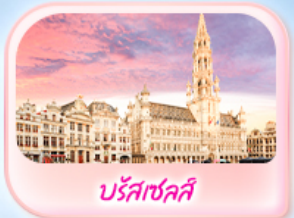
บรัสเซลส์