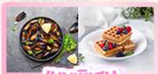
เมนูพิเศษ หอยมัสเซล+วาฟเฟิล