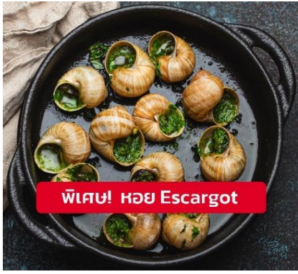
พิเศษ! หอย Escargot