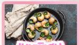
เมนูพิเศษ หอยออสตาโก้