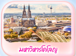
มทาวินดารโคโลญ