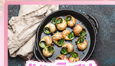
เมนูพิเศษ หอยเอสคาโท

เยอรมัน เนเธอร์แลนด์ เบลเยียม ฝรั่งเศส Keukenhof