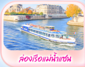
คลองเรือแม่น้ำแซน