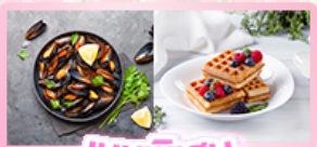
เมนูพิเศษ หอยมัสเซล+วาฟเฟิล