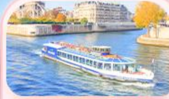
ล่องเรือแม่น้ำแซน