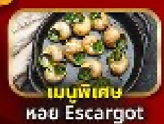
เมนูพิเศษ หอย Escargot