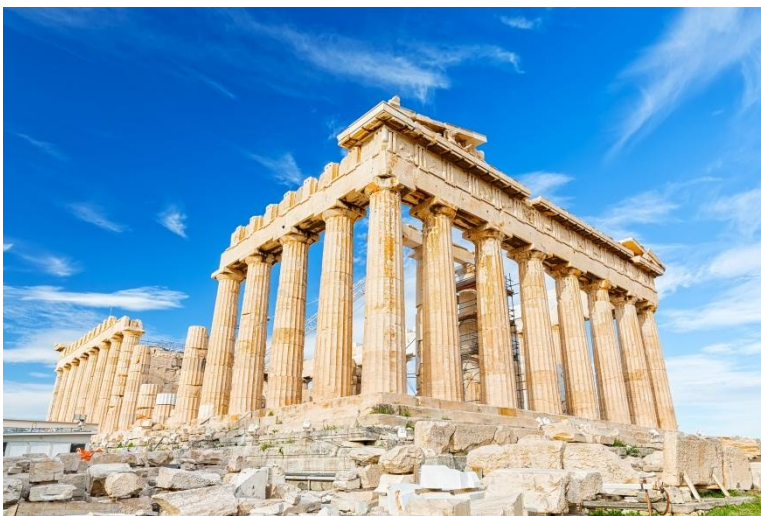
สร้างมาก่อนการสร้างเมือง ด้านบนเป็นที่ตั้งของ

เช้า บริการอาหารมือเช้า ณ ห้องอาหารของโรงแรมที่พัก