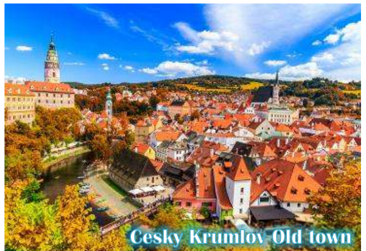
Cesky Krumlov Old town

บ่าย นำท่านเดินทางสู่ “เมืองเชสกี ครูมโลฟ (เมืองมรดกโลก)” เป็นเมืองขนาดเล็กในภูมิภาค โบฮีเมียใต้ของ สาธารณรัฐเช็กมีชื่อเสียงจากสถาปัตยกรรม และศิลปะของเขตเมืองเก่าและปราสาทครู มลอฟ ที่ยังคงมีเสน่ห์เหมือนอยู่ในเทพนิยายมา จนถึงทุกวันนี้ และน่าจะเป็นเมืองที่สวยงามที่สุดใน สาธารณรัฐเช็ก, เชสกี ครูมโลฟได้รับการจัด อันดับให้อยู่ในสิบเมืองที่สวยงามที่สุดในโลก เป็น หนึ่งในสถานที่ที่สวยงามที่สุดและไม่ควรพลาด ในการเดินทางไปสาธารณรัฐเช็ก เดินเล่นไปบน ถนนในยุคกลาง ปราสาทสไตล์บาโรกที่ไม่บุบ