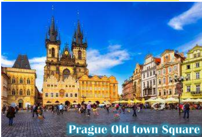
Prague Old town Square