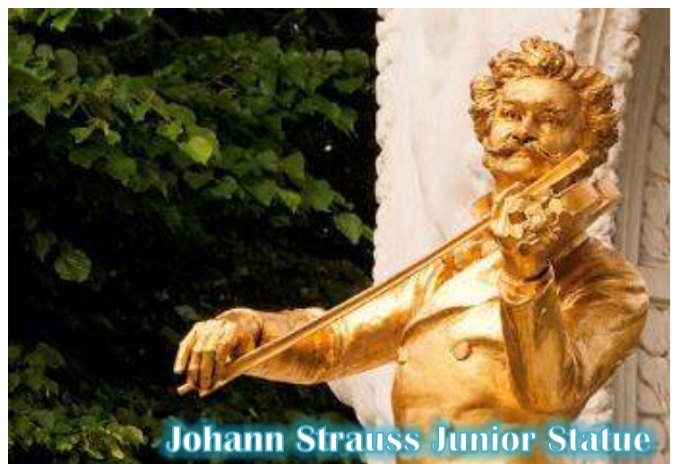
Johann Strauss Junior Statue

เช้า บริการอาหารเช้า ณ ห้องอาหารของโรงแรม นำท่านออกเดินทางเข้าสู่ใจกลาง “กรุง เวียนนา” (Vienna) ผ่าน “ถนนวงแหวน” Ring Strasse ซึ่งเป็นที่ตั้งของ โรง อوبرาการ (โอเปราเฮาส์), พระราชวังฮอฟบวร์ก, อาคาร รัฐสภา, ศาลาว่าการ, มหาวิทยาลัยเวียนนา, โบสถ์ประจำเมือง, ศาลสูง ฯลฯ เดินทางสู่ “สวนสาธารณะสตัดท์ปาร์ค” สวนสาธารณะอัน ร่มรื่นใจกลางเมือง ชม “ อนุสาวรีย์ โยฮัน สเต ราส์ จูเนียร์ ” Johann Strauss ศิลปินที่มี ชื่อเสียงก้องโลก