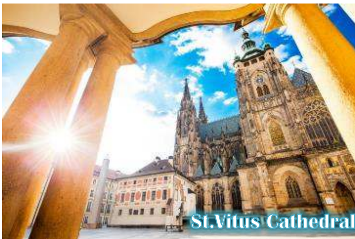
St. Vitus Cathedral