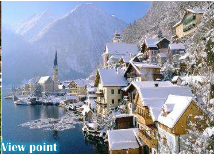
Hallstatt View point