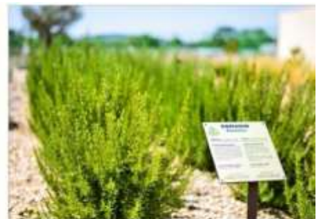
The Mediterranean Garden