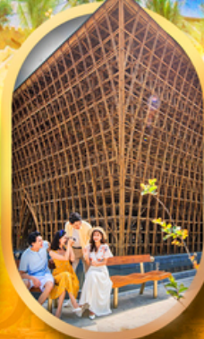
อาคารไม้ไผ่