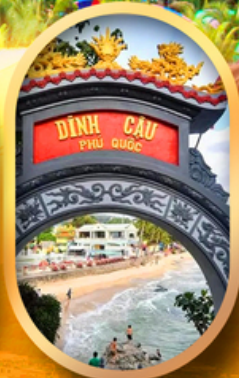
ศาลเจ้าดิงเกา