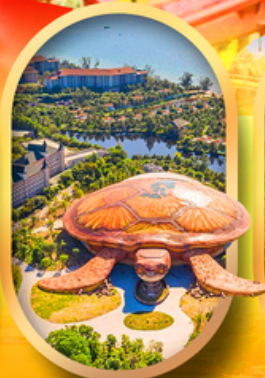
พิพิธภัณฑ์สัตว์น้ำ