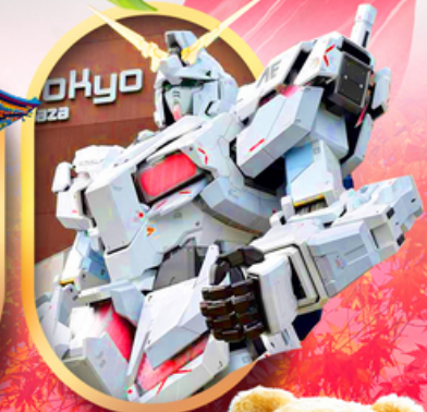
ห้างไอโดบะกันดั้ม