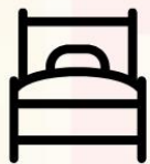
3.5-5ฟุต 1เตียง

ประเภทห้องพัก (เด็กอายุตั้งแต่6ปีขึ้นไป ต้องใช้เตียง) โปรดทำความเข้าใจในรายละเอียดห้องพัก **ห้องพักต่างประเภทอาจไม่ได้อยู่ในชั้นเดียวกัน**