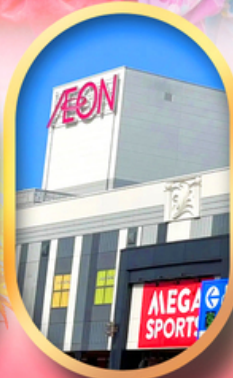
อีออนมอลล์