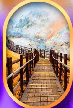
หุบเขานรกจิงคุดานิ