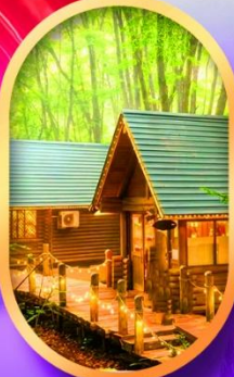
นิงเกิลทอรัส