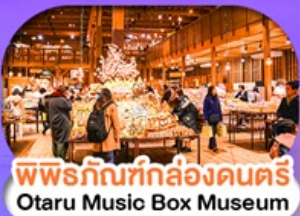
พิพิธภัณฑ์กล่องดนตรี Otaru Music Box Museum