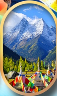
อุทยานสีครุณี