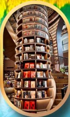
ร้านขายหนังสือ