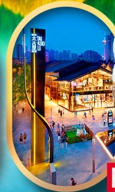
ถนนคนเดินไท่กู่หลี่