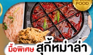
มือพิเศษ สุกี้หม่าล่า