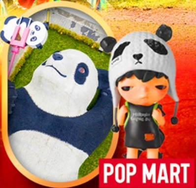
หมีแพนด้าเซลฟี