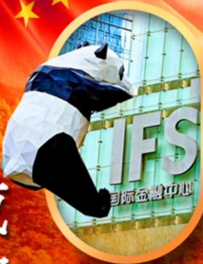
IFS หมีแพนด้าป็นติก