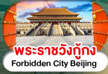
พระราชวังต้องห้าม Forbidden City Beijing