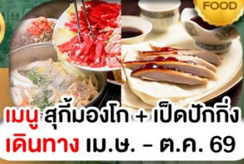
เมนูสุกั๋มโงโก + เปิดปักกิ่ง เดินทาง เม.ษ. - ต.ค. 69