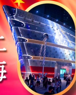
เรืออะพลุส์