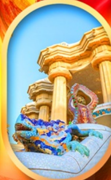
ปาร์ค กูเอล