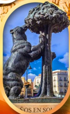
อนุสาวรีย์หมี