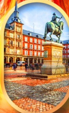
พลาซามายอร์