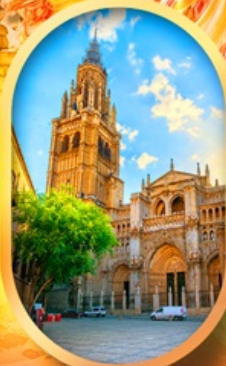
มหาวิหารโตเลโด