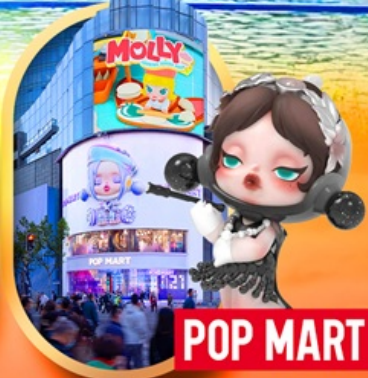
ถนนหนานจิง