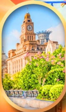
หาดไว่ทานเดอะบอนด์