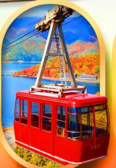
ขึ้นกระเช้าทะเลสาบมิกะตะ