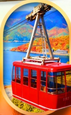
ขึ้นกระเช้าทะเลสาบมิกะตะ