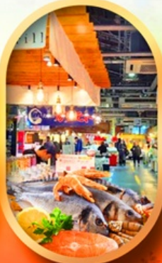
ตลาดปลาฮิองโตะ