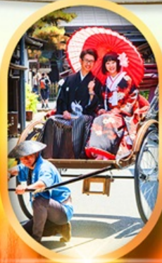
เมืองเก่าทาคายามา