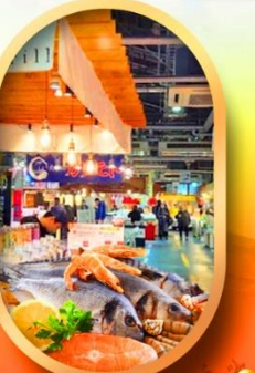
ตลาดปลาโงโถ