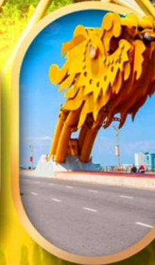
สะพานมังกรดามัง