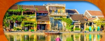
HoiAn Ancient Town ย่านเมืองเก่าฮอยอัน