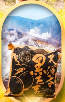
หุบเขาโอวาคุดานิ