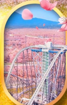
ฟูจิยาม่า ทาวเวอร์