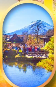
หมู่บ้านน้ำใส