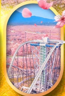
ฟูจิยาม่า ทาวเวอร์