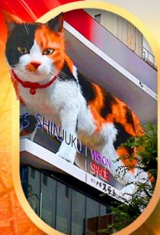
ช้อปปิ้งซินจุก