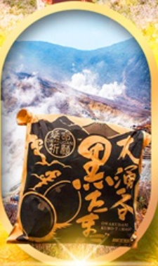
หุ่นเขาโอวาคุดานิ