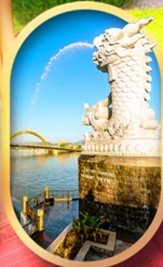
คาร์พดราท็อน