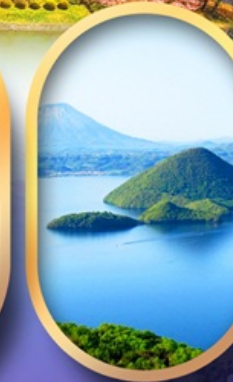
วิวทะเลสาบโทโยะ