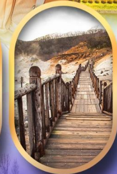
หุบเขาจิกุกุคานิ