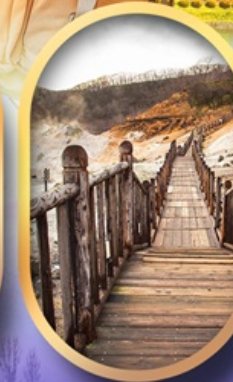
หุบเขาจิกุกดาบิ