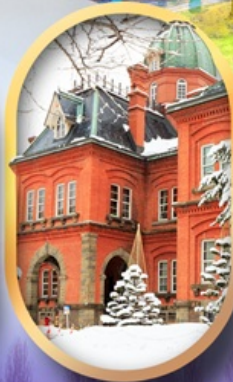
ศาลาว่าการฮอกไกโด