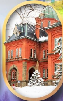
ศาลาว่าการฮอกไกโด