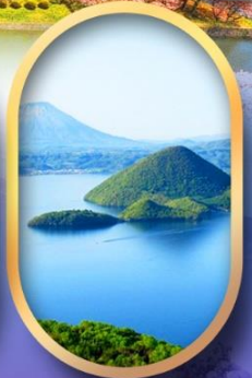
วิวทะเลสาบโทยะ