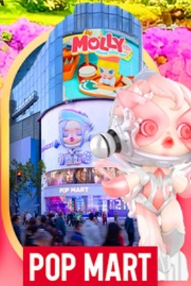
ช้อปปิ้งถนนหนางจิง