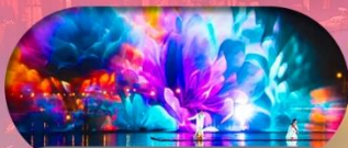
หมู่บ้านเมียนฮัววาน ชมแสงสียามค่ำคืน

เชียงใหม่ ทางโจว ล่องเรือทะเลสาบซีหู อุ๊ซี