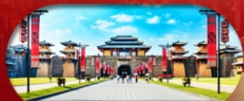
Hengdian World Studios โรงละครจำลองที่ใหญ่ที่สุดในโลก

เชียงใหม่ หางใจ หิ่งเทียน ล่องเรือทะเลสาบซีหู