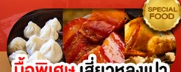
มือพิเศษ เสี้ยวหลงเปา หมูตงพอ ไก่จอกาน เดินทาง ม.ค. - มิ.ย. 69