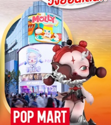
ช้อปปิ้งร้าน Pop Mart