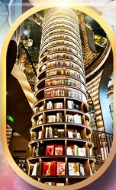
หอหนังสือจวงซูเก้อ