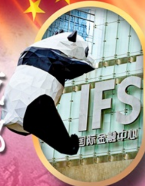
IFS หมีแพนด้าป็นตึก