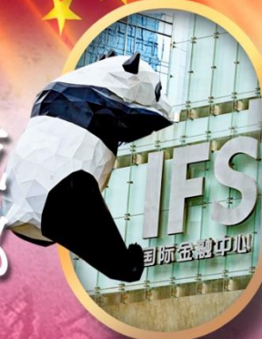
IFS หนีแพนด้าป็นตึก