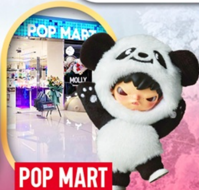
ช้อปปิ้งร้าน Pop Mart