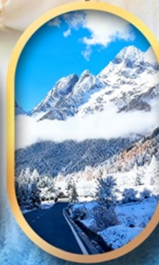
อุทยานสี่ครุณี