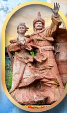
เมืองโบราณชางพาน