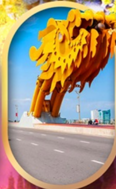
สะพานมังกรดานัง