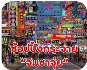
ช้อปปิ้งกระจาย "จิมซาจุ่ย"