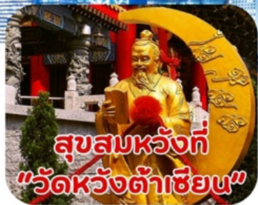
สุขสมหวังที่ "วัดหวังต้าเซียน"

*ราคาเริ่มต้นที่ 4,555.- บาท/ท่าน วันนี้-ธ.ค.67