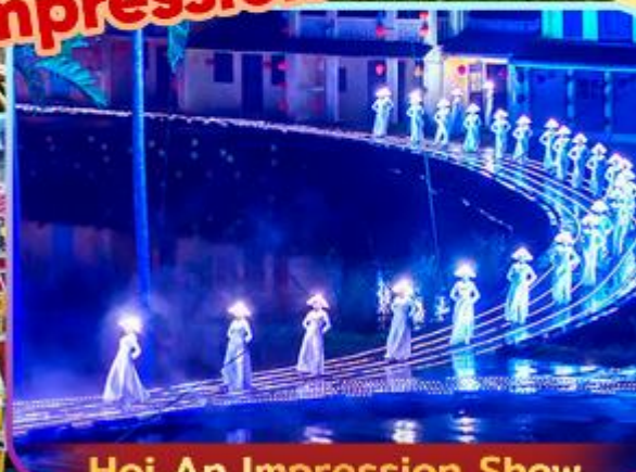
Hoi An Impression Show