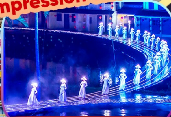
Hoi An Impression Show