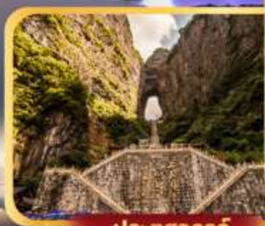
ประตูสวรรค์