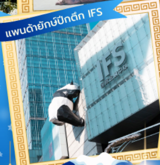
แลนด์มาร์กยักษ์ปิกติก IFS