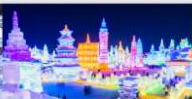
เทศกาลโคมไฟน้ำแข็ง