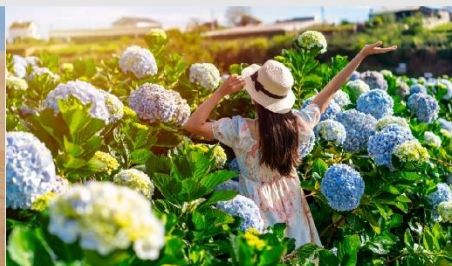
สวนดอกไฮเดรนเยีย