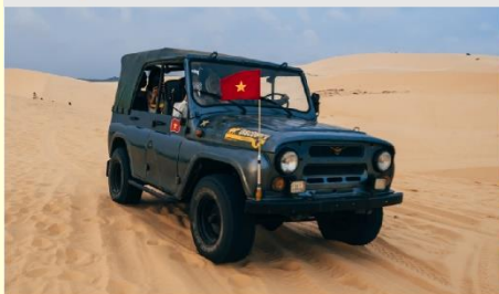
ทะเลทรายขาว