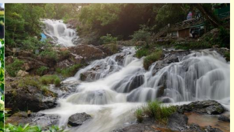
น้ำตกดาตันลา

*ทางบริษัทฯ ขอสงวนสิทธิ์ในการสลับโปรแกรมทัวร์ตามความเหมาะสมขึ้นอยู่กับสถานการณ์หน้างาน โดยคำนึงถึงผลประโยชน์ของลูกค้าเป็นสำคัญ