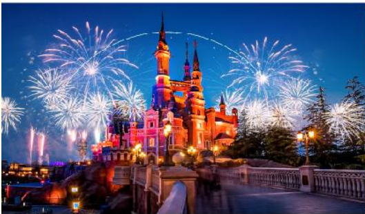
ดิสนีย์แลนด์