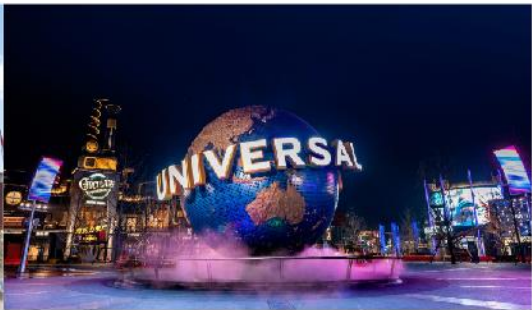
ยูนิเวอร์เซล ปักกิ่ง รีสอร์ท