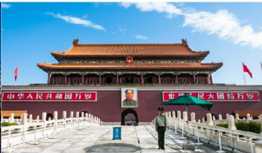
จัตุรัสเทียนอันเหมิน