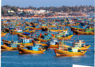
หมู่บ้านชาวประมงมุยเน่