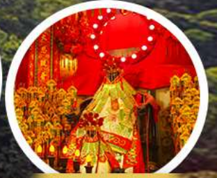
เจ้าแม่กวนอิมฮ่องกง