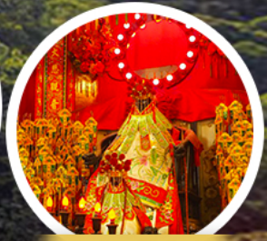
เจ้าแม่กวนอิมฮ่องกง