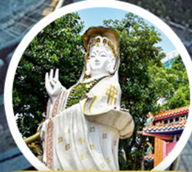
เจ้าแม่กวนอิม รัฟลส์ เบย์