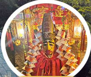
วัดหลินฟ้า