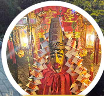
วัดหลินฟ้า