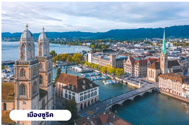
เมืองซูริค

เมืองซูริค ปัจจุบันจัตุรัสนี้ได้กลายเป็นชุมทางรถรางที่สำคัญของเมืองและยังเป็นศูนย์กลางการค้าของย่านธุรกิจ ธนาคาร สถาบันการเงินที่ใหญ่ที่สุดในประเทศ สวิตเซอร์แลนด์ นำท่านแวะถ่ายรูปกับ โบสถ์ฟรอมุน