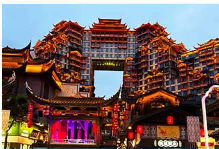
ตึกมหาศรัสมย์ 72 ชั้น

เสื้อผ้าและของใช้ 1 ชุด เพื่อ นอนพักในเมืองเก่าฟูหรงจิ้นในคืนที่ 3 ของการเดินทาง ขอเป็นกระเป๋าผ้า กระเป๋าถือลากใบเล็กไม่สามารถขึ้นรถกอล์ฟเข้าในหมู่บ้านได้ เป็นข้อห้ามของรถ จำเป็นต้องเรียนให้ท่านทราบต้องเป็นกระเป๋าผ้าหรือเป้เท่านั้น