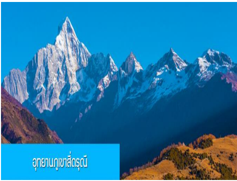
อุทยานกุเสี้อรุณี

หลังอาหารนำท่านเที่ยวชม หุบเขาขวงเฉียวโกว 双桥沟景区 ที่เป็นแหล่งท่องเที่ยวที่สวยงามที่สุดแห่งหนึ่งในเขตอุทยานกุเสี้อรุณี นำท่านนั่งรถบั๊สของอุทยานที่วิ่งไปผ่านเส้นทางที่สร้างคู่ขนานกับลำธารกษยในหุบเขา ท่านจะได้สัมผัสกับความสวยงามของทัศนียภาพธรรมชาติที่หาชมได้ยาก โดยมีภูเขาหิมะสูงตระหง่านอยู่เบื้องหลัง ธารน้ำใสไหลริน และสระน้ำที่มีสีเขียวมรกต ในฤดูใบไม้ผลิและฤดูร้อนท่านจะได้เห็นฝูงจามรีท่ามกลางทุ่งหญ้าเขียวขจี ส่วนในฤดูหนาวทุ่งหญ้าและพื้นดินจะปกคลุมด้วยพรมหิมะสีขาว....รถบั๊สของอุทยานจะนำนักท่องเที่ยวไปยังจุดชมวิิวสำคัญต่าง ๆ ภายในเขตอุทยาน เพื่อให้นักท่องเที่ยวได้เที่ยวชมสถานที่และถ่ายรูปตามอัธยาศัย จนครบแ่วเวลา นำคณะขึ้นรถบั๊สออกจากอุทยาน