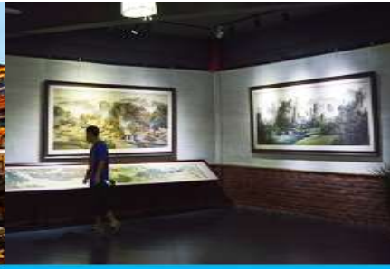
พิพิธภัณฑ์ภาพหินทราย